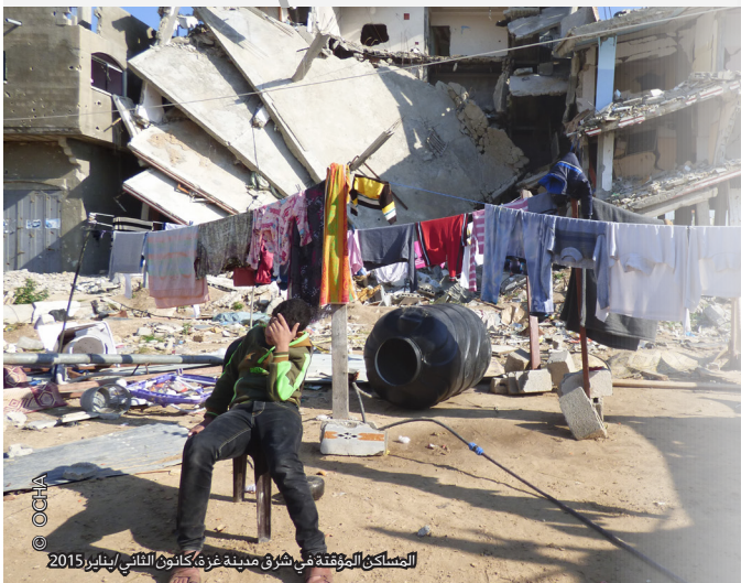
المساكن المؤقتة في شرق مدينة غزة، كانون الثاني/يناير 2015

غزة: الأضرار التي لحقت بالبيوت جراء العمليات العسكرية الإسرائيلية