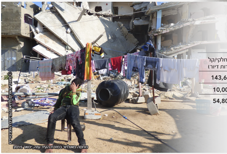
מחסה מאולתר במזרח העיר עזה, ינואר 2015