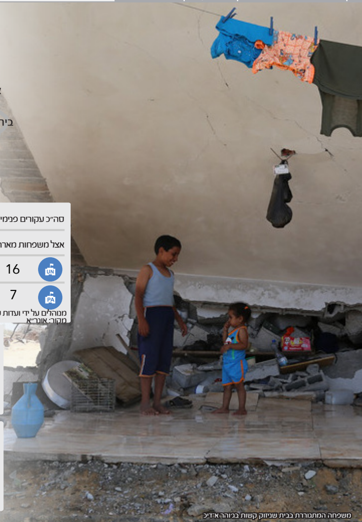
משפחה המתגוררת בבית שניזק קשות במזרח ארז